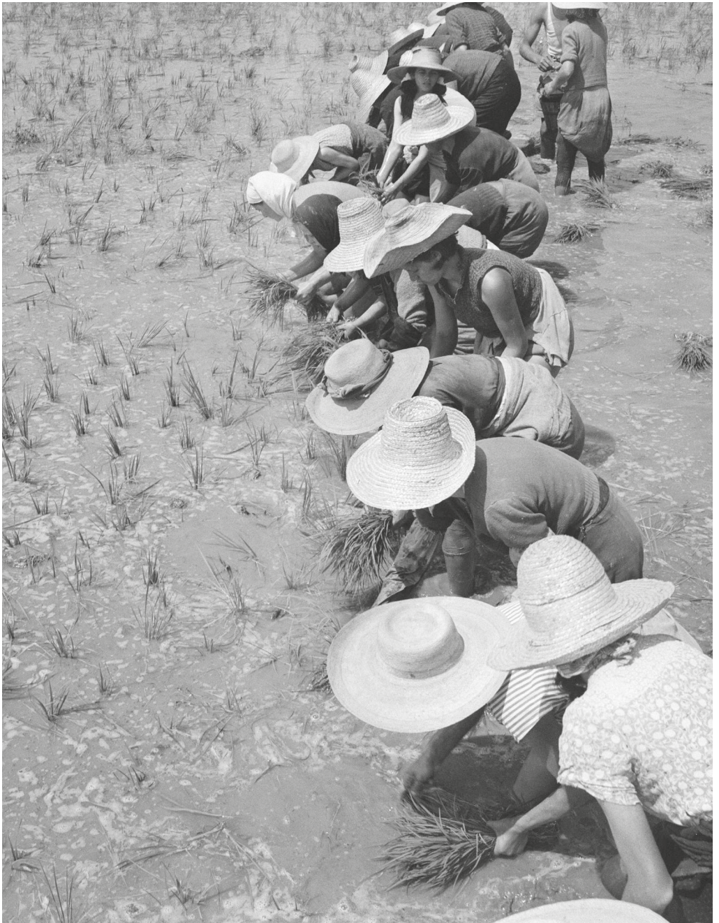
La nostra idea di cucina